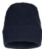
dark navy (580)