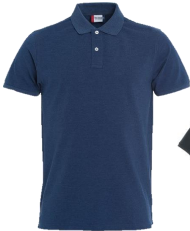
Blau meliert (565)

Ein qualitativ hochwertiges Polo-Shirt aus weichem, hochwertigem Material mit Stretch-Anteil. Zwei Perlmutterknöpfe für Herren und drei für Damen. Fischgräten-Nackenband und Ziernähte an den Seitenschlitzen. Vorgeschumpft und enzymbehandelt für eine weiche und glatte Oberfläche. Waschbar bis 40°C. Material: 95% Baumwolle / 5% Elasthan, Gewicht: 215 g/m 2