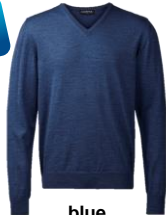
blue melange (116)