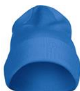
ocean blue (632)