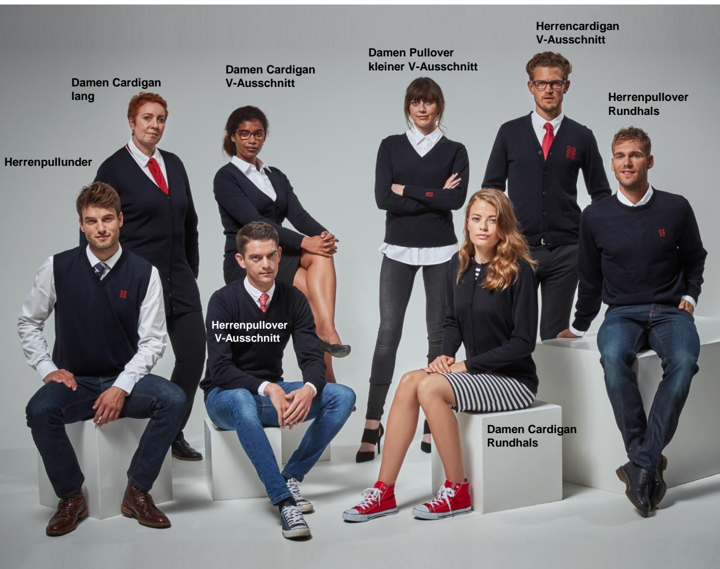
Damen Cardigan lang