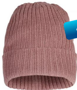
frosted pink (203)