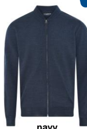
navy melange (812)