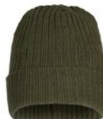
fog green (75)