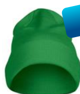
fresh green (728)