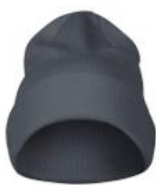
steel grey (935)