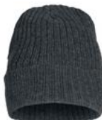
anthrazit melange (955)