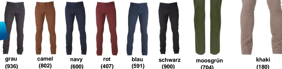
grau (936) camel (802) navy (600) rot (407) blau (591) schwarz (900) moosgrün (704) khaki (180)

Herren und Damen in Größe: 30/32, 30/34, 31/32, 31/34, 32/32, 32/34, 32/36, 33/32, 33/34, 33/36, 34/32, 34/34, 34/36, 36/32