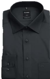
Schwarz (68) Dunkelblau (18)