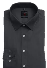
Schwarz (68) Dunkelblau (18)