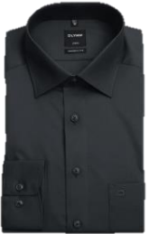
Schwarz (68) Dunkelblau (18)